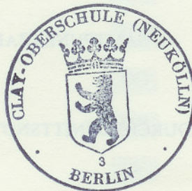
Siegel der Schule